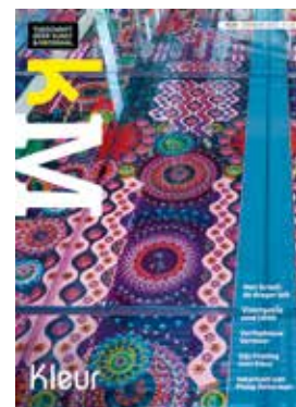
Omslag Suzan Drummen, detail. Depot Boijmans van Beuningen.